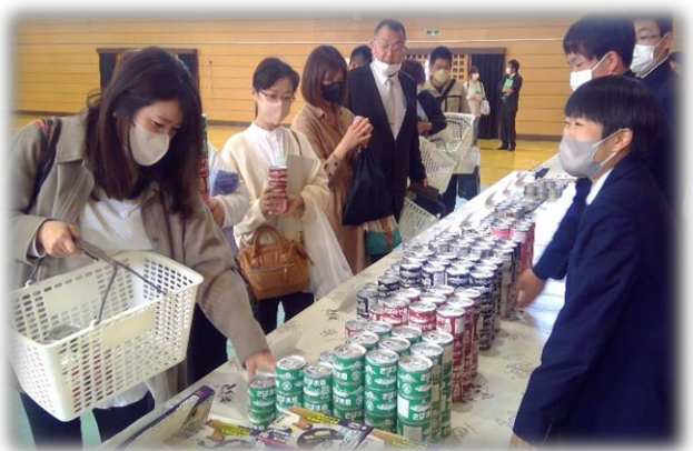
総会后、海星屋でお買い物を楽しみました。